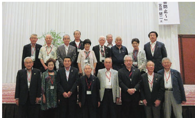
参加した長崎県老連の皆さん