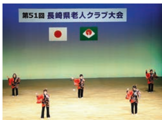
吉岐市老連 「おまんた囃子」