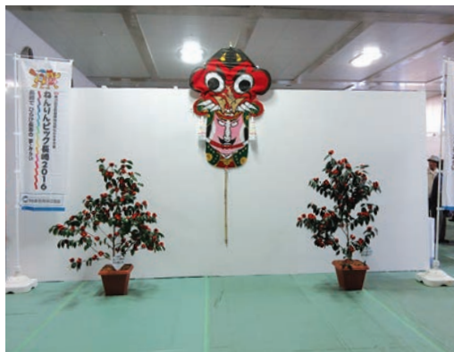
満開の折紙の椿と鬼凧

会場入り口に、満開の折紙の椿の花の樹木と鬼凧でお出迎えし、期間中、先着順に、女性部会の手作りによる「つばき・あじさい」の折紙や「まゆ玉」を来場記念として配布しました。