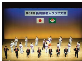
諫早市老連 「小野町浮立とのんのご皿踊り」