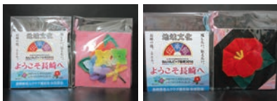
あじさい・つばき