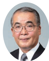
長崎県知事 中村 法道