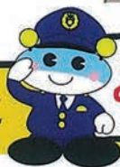
長崎県警マスコット キャツチくん